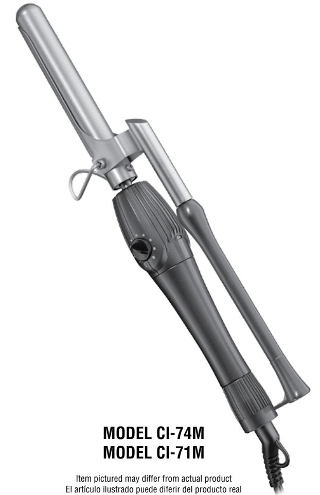
MODEL CI-74M MODEL CI-71M

Item pictured may differ from actual product El artículo ilustrado puede diferir del producto real